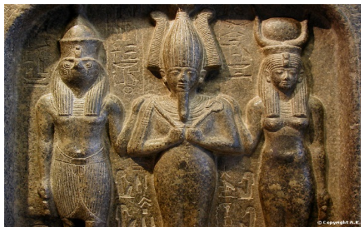
Рис. 2. Осирис, Изида, Гор

В некоторых религиях, в вероучениях которых присутствует божественная триада, судьба Бога Сына имеет подобную историю. По мнению Дж. Фрэзера, образы умирающего и воскресающего бога (Осирис, Дионис) являют собой символическое олицетворение сил природы, которая «умирает» зимой и «воскресает» весной. Согласно Фрэзеру, сюжет об умирающих богах в мифологии восходит к обычаю древних народов умерщвлять сына правителя (царя) при неурожаях в целях изменения ситуации [Фрэзер, 1998].