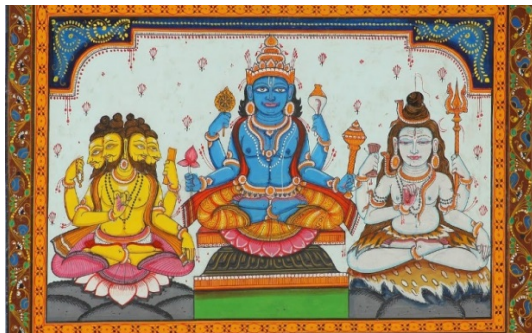
Рис. 1. Тримурти (санскр. – «три образа»): Брахма, Вишну, Шива